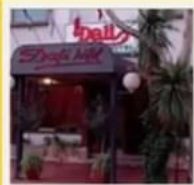
📞 DALÍ **