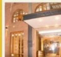
📞 SAN MARTÍN ***