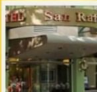
📞 SAN RAFAEL ***