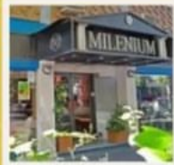
📞 APART MILENIUM

[BASE DBL] [BASE TPL: 59569 | CPL: 55839]