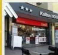
📞 KALTON ***

[BASE DBL] [BASE TPL: 69169 | BASE CPL: 63839]